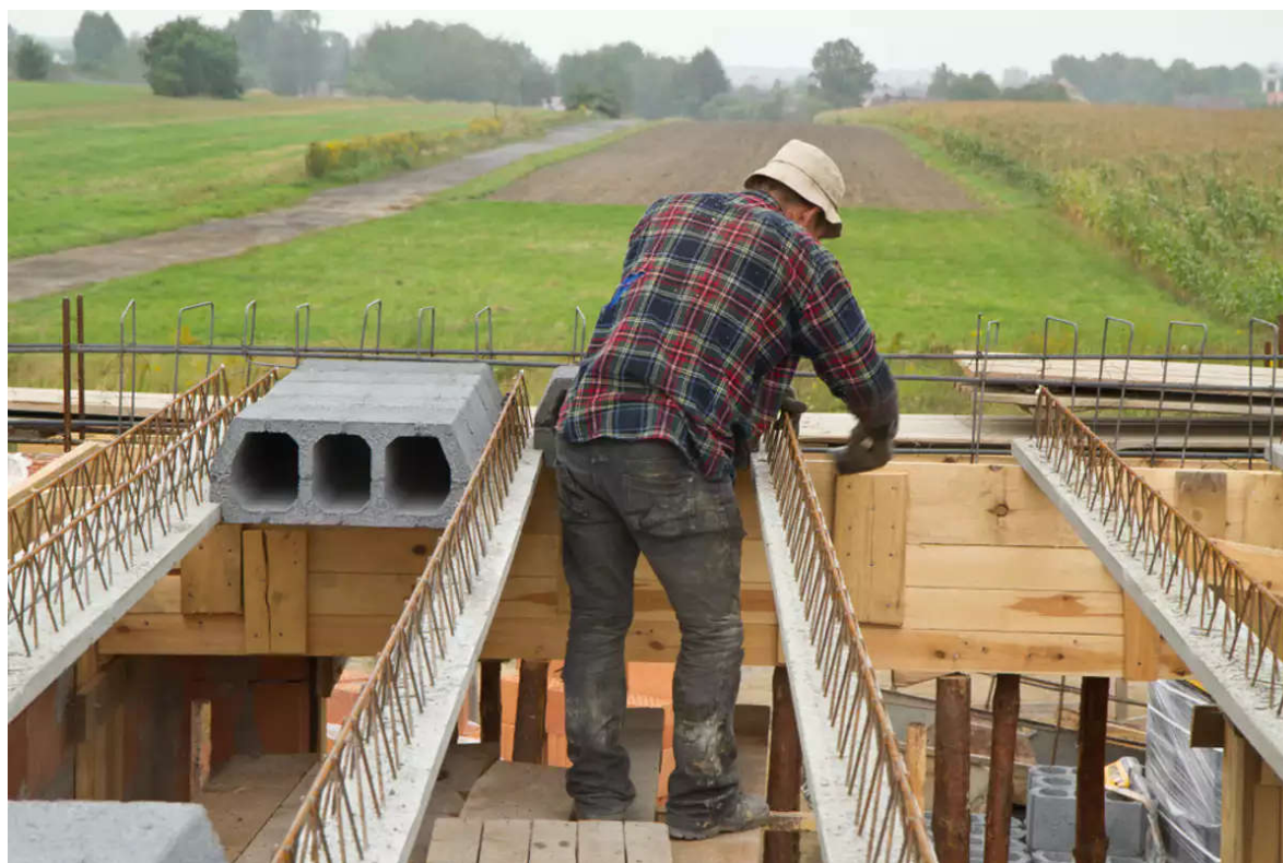
La directive sur les travailleurs détachés a été révisée en 2018.

Mais le chemin vers l'harmonisation sociale et fiscale, s'il n'est plus aussi utopique aujourd'hui qu'hier, sera vraisemblablement encore long. La perspective du Brexit n'arrange pas les choses. En effet, si la sortie des Britanniques de l'UE présente un avantage certain dans la reprise des discussions sur la question de l'harmonisation (car ils s'y sont toujours fermement opposés), elle interroge toutefois sur le financement qu'impliquerait une telle convergence des systèmes sociaux et fiscaux. L'harmonisation a un coût, surtout si on souhaite qu'elle se fasse par le haut. Or, le Brexit aura un impact non négligeable sur le budget communautaire, le Royaume-Uni étant l'un des principaux contributeurs nets.