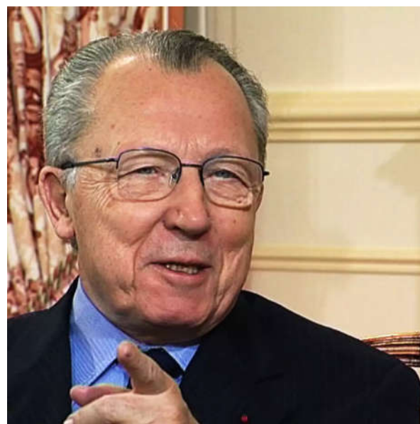
Jacques Delors à Lausanne, en 2001.

S'il ne parlait pas explicitement d'une harmonisation sociale, il reconnaissait néanmoins la nécessité d'approfondir le « dialogue avec les gouvernements et les partenaires sociaux en vue de s'assurer que les opportunités offertes pour l'achèvement du marché intérieur soient accompagnées de mesures appropriées pour atteindre les objectifs de la communauté en matière d'emploi et de sécurité sociale ».